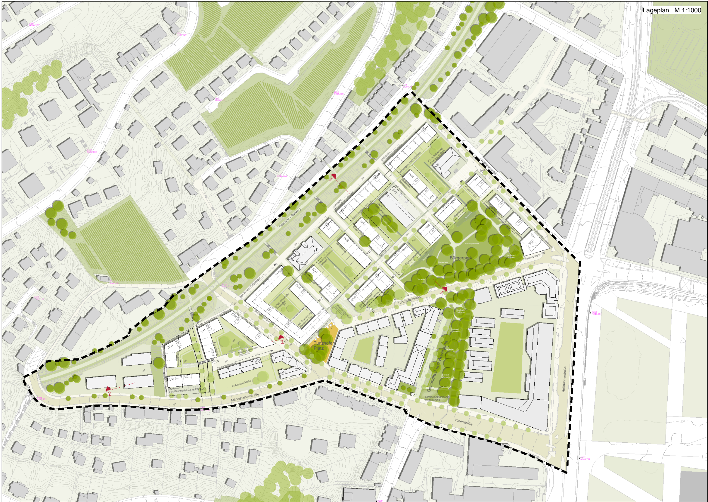
Lageplan M 1:1000